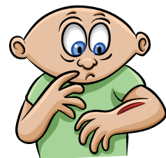
Infecciones o lesiones tardan más de lo usual en sanar

Para más información, visite Cornerstones4Care.com